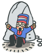
La elva leve