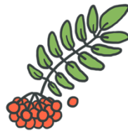
Rogna på Vardøhus