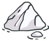
Opp fra isen