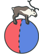
Reinsdyr og landegrensar