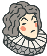
Thomas von Westen